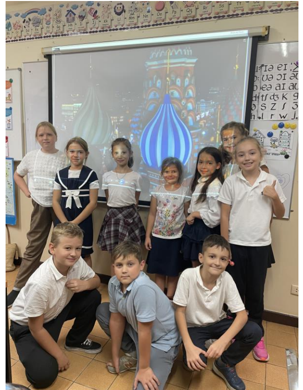
Обучающиеся 5-6 классов посмотрели научно-популярный фильм «Что за праздник мы празднуем 4 ноября?»